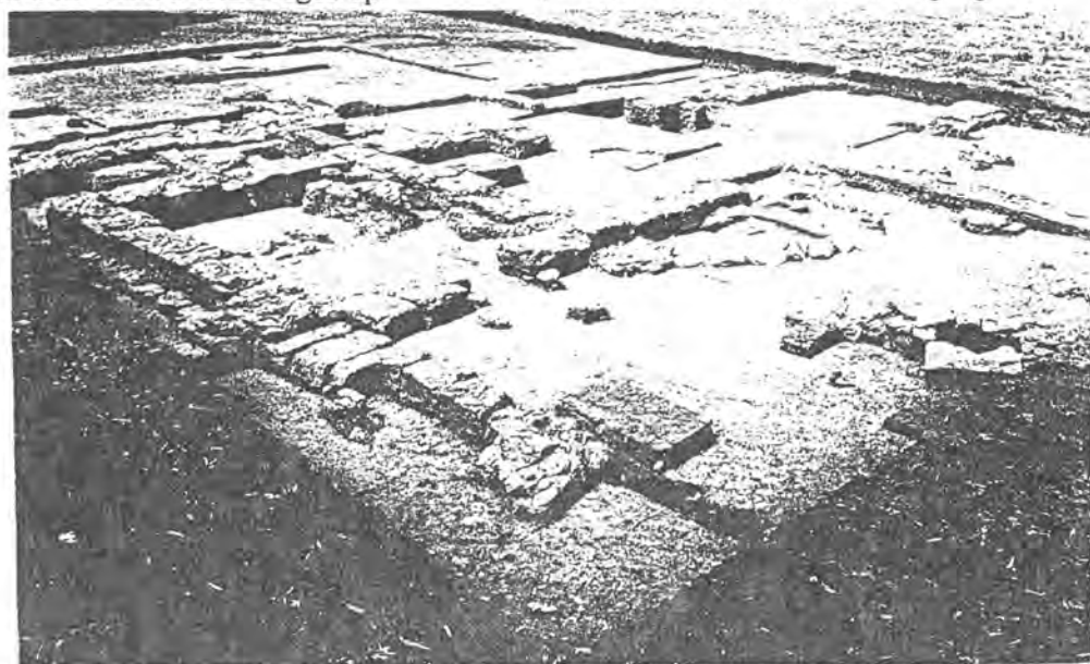
Overzicht van het opgravingsveld tijdens de campagne van 1992.

Evenals in het eerste huis bevindt zich in de open hof een waterput. Rondom deze waterput werden nog resten van een kiezelvloer aangetroffen. De hof is aan de zuidkant afgesloten door een muur met een monumentale toegang.