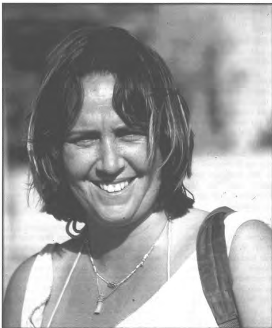
De koningin van Satricum

enorme ervaring en mensenkennis opgedaan. Het is mij duidelijk, ze heeft een natuurlijke aanleg voor leiderschap en begeleidt de studenten op ideale wijze. Het onderwijs dat onze studenten hier krijgen is ongelooflijk belangrijk voor hun ontwikkeling als archeoloog. Alleen daarom al moet 'Satricum' in de toekomst voortgezet worden. Dit ga ik als ik terug ben onze decaan nog eens duidelijk maken.