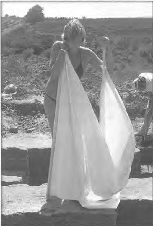
Een sierlijke verschijning op het veld.

vlug op zijn waarde weet te schatten. Of je meer een tekenaar bent of een graver of weer iets anders. Ze ziet in een oogopslag je talenten en haalt dan het beste uit je. Ze geeft bovendien veel aandacht aan mensen, zonder dat het er te dik boven op ligt. Daarom voelt iedereen zich gewaardeerd. Dat is haar geheim.'