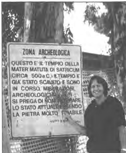
Op de acropolis, bij de resten van de tempel van Mater Matuta.