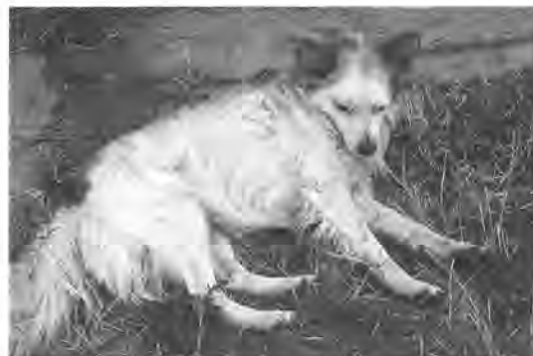
Het kleine witte hondje Picchio, het opgravingshondje tijdens de eerste jaren van het Satricum-onderzoek

Dan kwamen er ideeën voor tentoonstellingen: toch wel bijzonder wat jullie daar vinden en niemand kent dat, zullen we eens iets leuks maken? Latina was de eerste, met een congres en een officiële opening door die prachtige president die Italië toen had, Pertini. Vervolgens kwamen er tentoonstellingen in Albano, bij het Ministerie van Cultuur, in het Museum van de Villa Giulia, in Aprilia, en in Leiden en Nijmegen. Ook de tentoonstellingen die uiteindelijk niet doorgingen leverden wel iets op voor het project als geheel. De andere brachten niet alleen een paar maanden inkomsten voor de medewerkers met zich mee, maar ook positieve publiciteit en vooral een aantal mooie catalogi. Deze wetenschappelijk verantwoorde maar aantrekkelijke uitgevoerde boeken bleken een plezierig middel om tussentijdse resultaten bekend te maken.