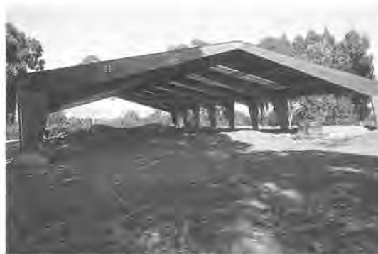
De overkapping van de fundamente van de tempels van Mater Matuta. Sinds juli 2001 een feit.

Er zijn zelfs plannen om Satricum een eigen museum te geven. De talloze vondsten uit de Nederlandse opgravingen zouden dan eindelijk de plaats krijgen die ze verdienen. Niet dat de Lapis Satricanus hier zal worden opgesteld. Die heeft sinds kort, na lange tijd 'onvindbaar' te zijn geweest als gevolg van een lange politieke strijd tussen elkaar beconcurrerende Italiaanse instanties,