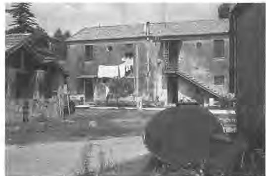
Het opgravingshuis, ook wel de azienda genoemd