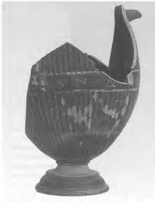
Zwartgeverniste vaas met wij-inscriptie aan Mater Matuta gevonden tijdens de heropgraving van het 'Hellenistisch' Votiefdepot in 1989

best worden aangetoond aan de hand van de vele tempelterraccotta's en de architectuur. Elke tempelfase heeft zo zijn eigen stijkenmerken die corresponderen met de op dat moment gangbare gebruiken in de naburige gebieden van Campanië en Etrurië. En wat te denken van de plattegrond van de laatste tempel van Mater Matuta, gedeelte-