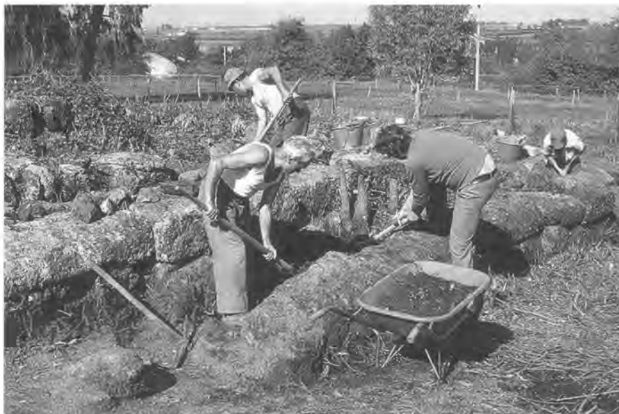
1977 – begin van het Nederlandse onderzoek in Satricum: schoonmaak van het zwaar overwoekerde tempelcomplex van Mater Matuta

Ieder jaar moest opnieuw een aanvraag voor een vergunning, begeleid door een verslag van de voorafgaande campagne, worden ingediend. De autoriteiten hadden normaal dan zo'n acht maanden nodig om tot een officieel antwoord te komen. Meestal kwam de permissie tot voortzetting van het onderzoek in de maand juni van het