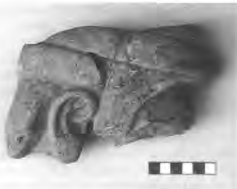
Fragment van een levensgrote terracotta kop van Heracles behorend bij een Athena- en Heraclesgroep die het dak van het eerste kleine tempeltje van Satricum sierde.