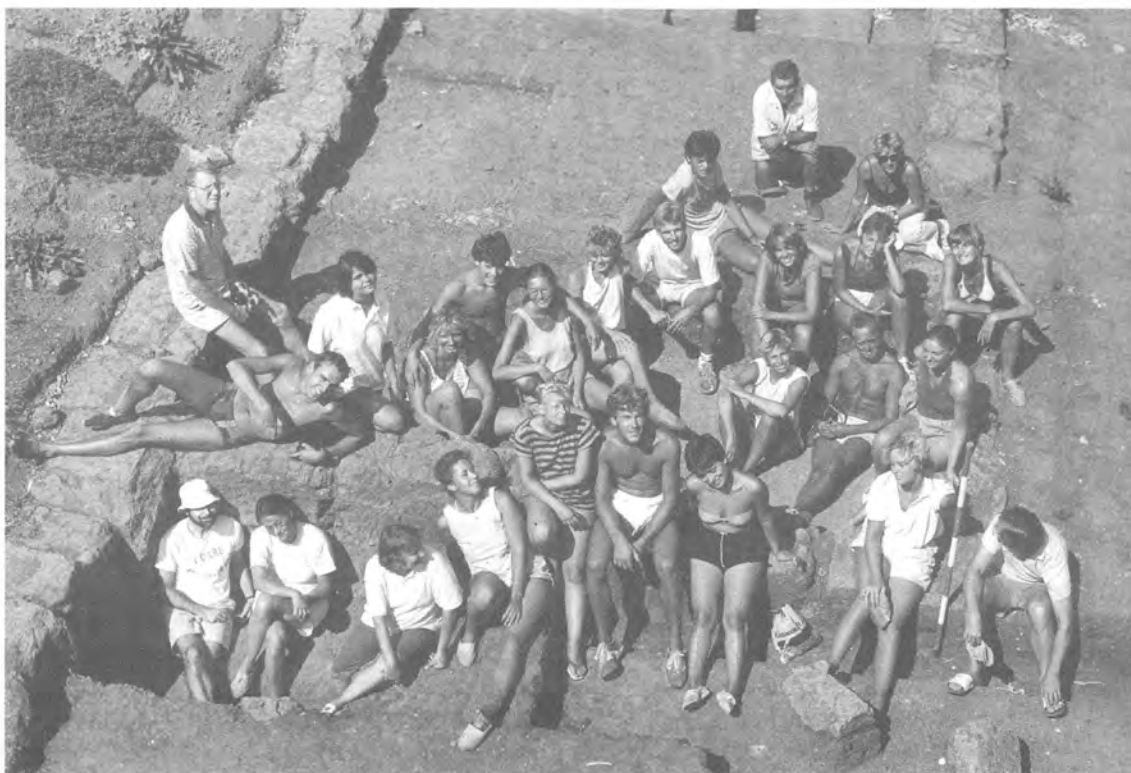
De opgravingsploeg uit 1985