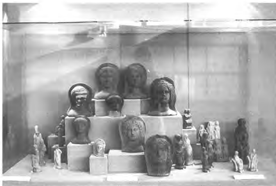
Een van de vitrines op de Satricum-tentoonstelling in Latina. Opgesteld zijn de terracotta votief-gaven afkomstig uit het 'Hellenistisch' Votiefdepot.

volgend jaar aan, zodat we officieel pas in juli het werk konden hervatten. Een voorjaarscampagne, die we in de loop der jaren af en toe hielden, was dan strikt genomen illegaal. De meeste studenten die deelnamen aan de campagnes, hadden geen flauw vermoeden van wat er allemaal vooraf was gegaan aan het moment waarop de eerste spade, elk jaar opnieuw, de grond inging. Maanden van voorbereiding waren daarvoor nodig, net zoals het maanden kostte om na hun vertrek het veldwerk af te ronden, de vondsten op te slaan, de opgravinghuizen op te ruimen, de financiën af te sluiten, de resultaten te controleren, verslagen voor Nederlandse geldgevers en Italiaanse autoriteiten op te stellen en, voor een deel althans, voorlopige rapporten te publiceren en op congressen te bespreken.