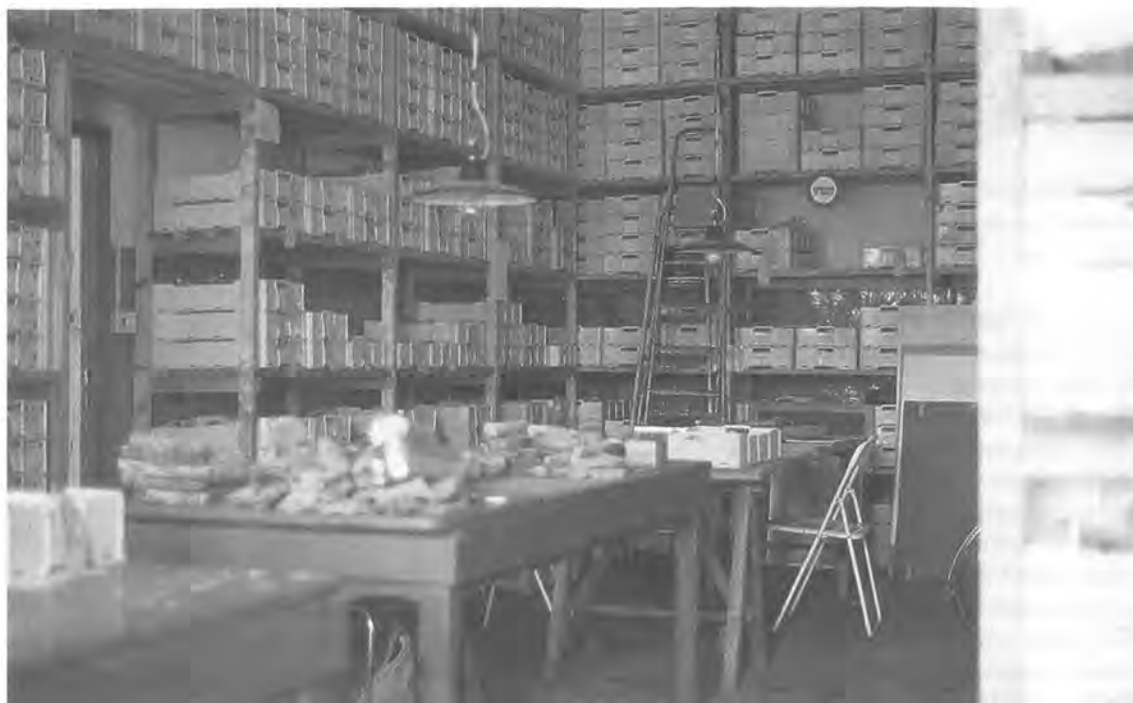
Het Nederlandse magazijn 'de Dispensa'