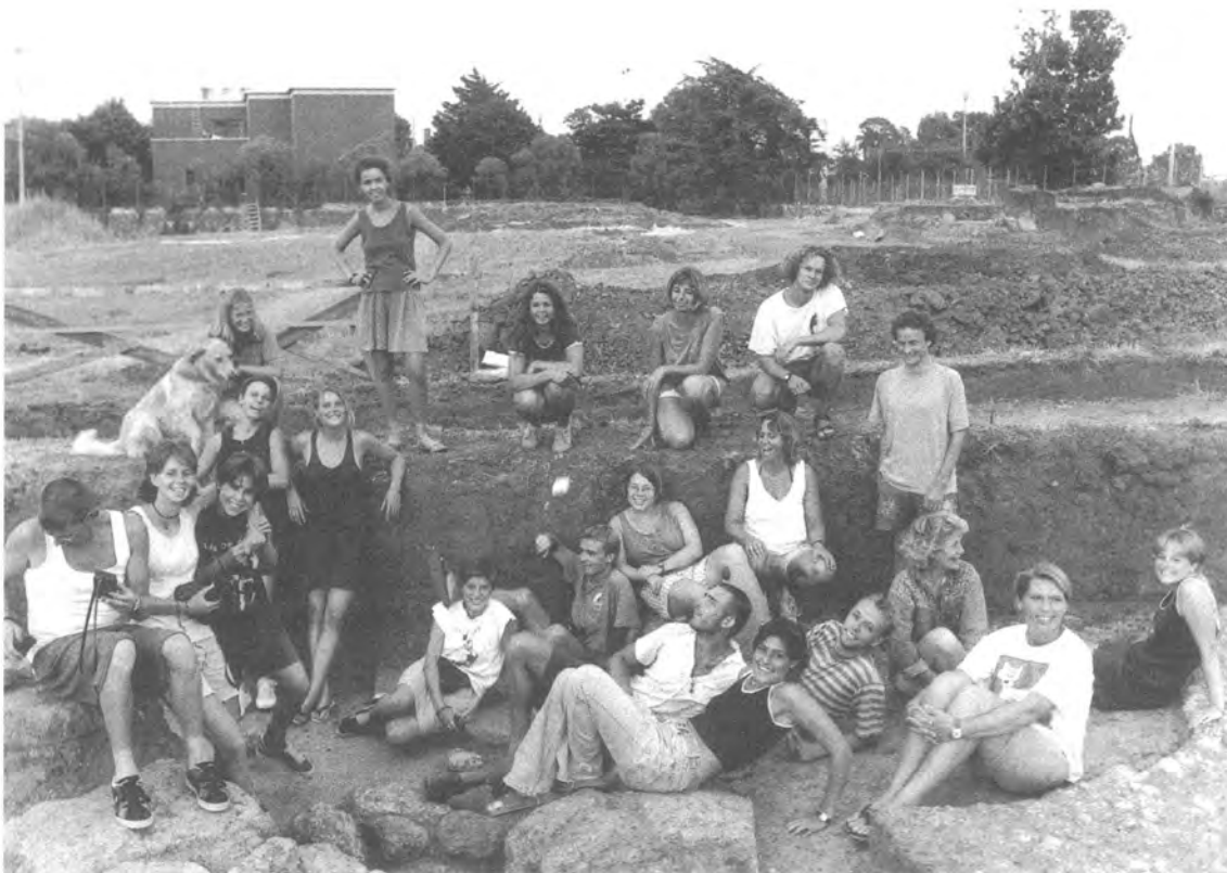
De opgravingsploeg uit 1997