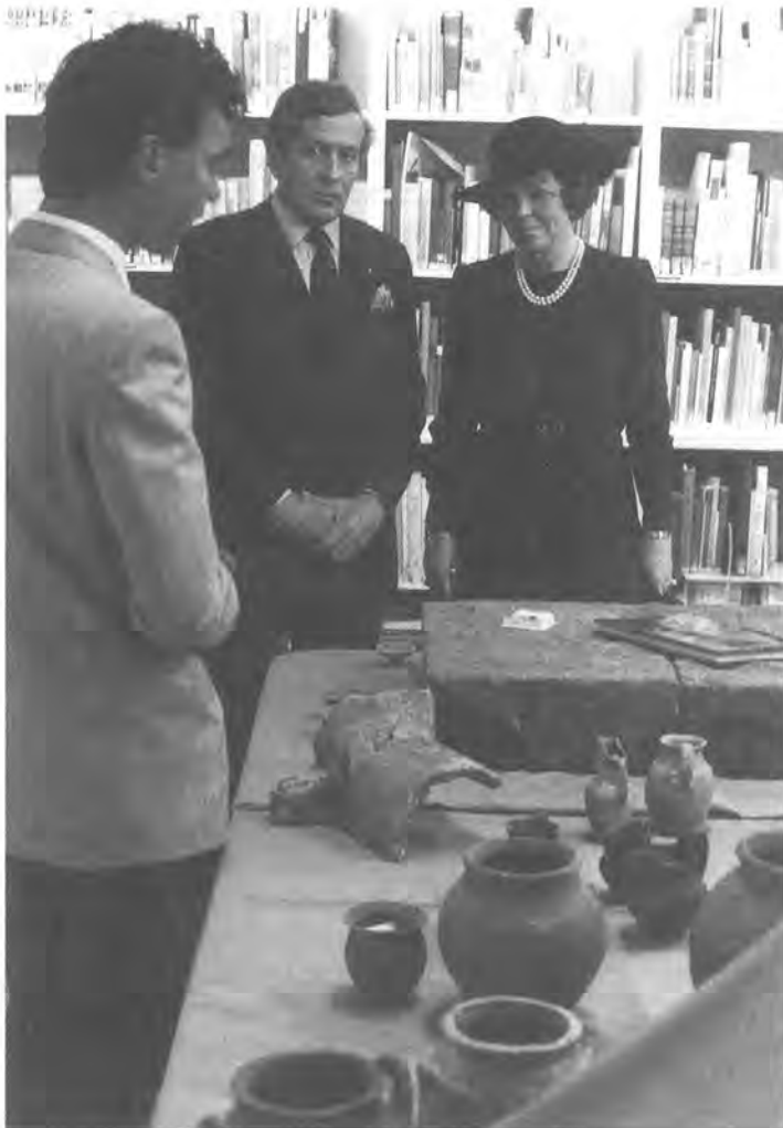
Riemer Knoop geeft uitleg aan Koningin Beatrix en Prins Claus

Nog een voorbeeld van samenwerking. In 1982 vierde de provinciehoofdstad Latina, ongeveer 20 km ten zuiden van Satricum, haar vijftigjarig bestaan. Dat moest natuurlijk groots worden gevierd, ook al was die stad (na de drooglegging van de Pontijnse moerassen) door Mussolini gesticht. Deze pijnlijke bijzonderheid werd tactvol naar de achtergrond geschoven. Voor zulke feesten worden in Italië heel wat financiën ter beschikking gesteld en allerlei dingen waaraan men anders niet denkt, worden plotseling moge-