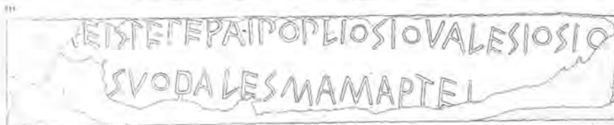
De Lapis Satricanus, de oudste samenhangende Latijnse tekst gevonden in het fundament van de tempel van Mater Matuta. De inscriptie vermeldt de naam van de historische figuur Publius Valerius Publicola, de eerste consul van Rome.