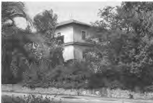
Het mooiste gebouw in Borgo Le Ferriere voorbestemd als 'Villa Hollandese'

Dit was dus het voorspel voor het eigenlijke toneelstuk, dat in Satricum zou worden opgevoerd