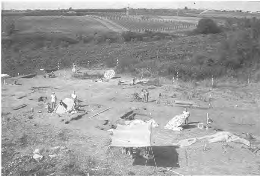
Opgraving van het 5de-eeuwse Volskische grafveld in de zuidwest hoek van het antieke stadsge- bied van Satricum

gevonden uit latere periodes. Het is met name deze jongere geschiedenis van Satricum die in de laatste jaren veel aandacht heeft gekregen. De 5de-eeuwse graven bleken bijvoorbeeld een essentieel element in de discussie over de historische aanwezigheid van de Volsken, een inheems Italiaans bergvolk, in Satricum.