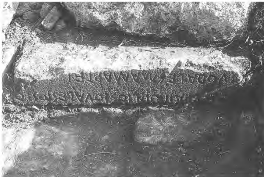
De Lapis Satricanus verborgen in het fundament van de tempel van Mater Matuta

Om de situatie te verduidelijken: die 5000 gulden was door het toenmalige Ministerie van CRM (nu ter ziele) ter beschikking gesteld in een soort automatisme, niet omdat men vond dat het nodig was. Het NIR, dat onder dat merkwaardige ministerie ressorteerde, had op de nooit eerder ingevulde, maar wel bestaande begrotingspost 'opgravingen' al in 1976, dus één jaar voor het begin van de opgravingen in Satricum, het betreffende bedrag van het ministerie gekregen. Die toekenning was tegen wil en dank geschied, onder druk van hoger