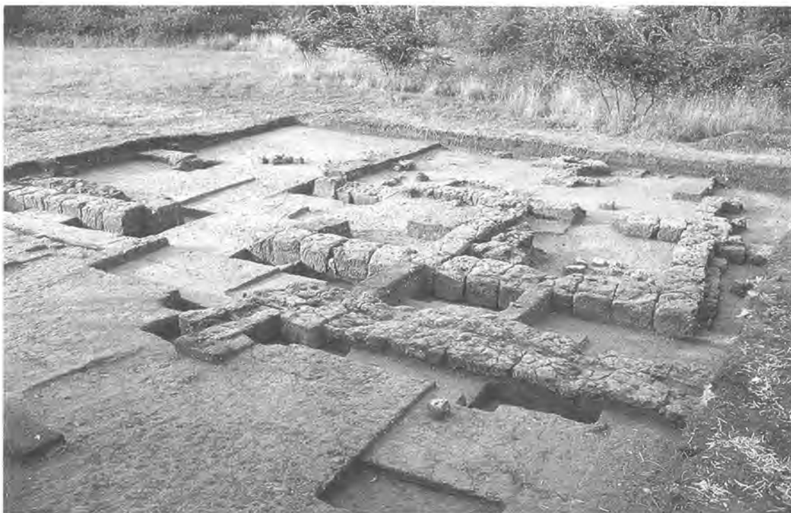
De resten van een monumentaal huizencomplex dat in 1992 werd opgegraven op de oosthelft van de akropolis

die zeer tot de verbeelding sprak en op bepaalde niveaus binnen het Italiaanse circuit tot onrust had geleid. Politiek blijkt in Italië dan nauw verbonden te zijn met de opgravingspraktijk. Het positieve verloop van het onderzoek was in elk geval geen garantie voor het verkrijgen van een opgravingsconcessie, althans zo bleek al meteen bij de eerste opgravingscampagne onder nieuwe leiding, in 1992. De vergunning die zoals altijd voor 21 oktober van het voorafgaande jaar was aangevraagd, kwam niet. Een speciaal vanuit Nederland geregeld bezoek aan de Soprintendente mocht niet baten. De hooggeplaatste bleek op het afgesproken uur ineens een andere afspraak te hebben en was verder niet meer voor commentaar bereikbaar, een praktijk die in de hierop volgende jaren wel vaker zou optreden. Ondergetekende kon onverrichter zake terug naar Nederland reizen.