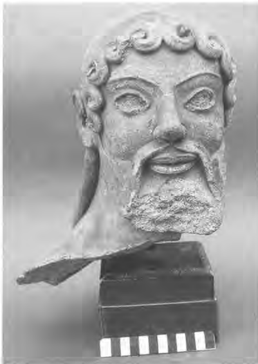
De Jupiterkop, fragment van een van de 12 bijna levensgrote terracotta beelden die de nokbalk van de tweede tempel van Mater Matuta sierden

Moretti reageerde onmiddellijk: "forse? forse? è sicuro che le terrecotte di Satricum saranno esposti qui, anche subito!" ("Wat "misschien"?