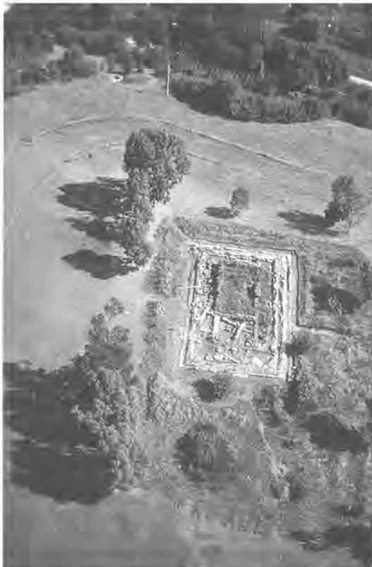
Luchtfoto van de fundamenteën van de drie opeenvolgende tempels van Mater Matuta op de akropolis

De verschillende noodopgravingen die vanaf 1980 achtereenvolgens door het team van het NIR en dat van de Universiteit van Amsterdam buiten de akropolis zijn uitgevoerd, plaatsten de resten op de akropolis in een breder perspectief, zowel in historisch als in urbanistisch opzicht. Hoewel het om vrij geïsoleerde kijkgaatjes in het grote stadsgebied ging, waren de resultaten zo opzienbarend dat ze het tot dan toe gangbare beeld van Satricum in diverse opzichten nuanceerden. Zo bleek het hardnekkige idee dat er van Satricum vanaf circa 500 v.Chr. niet veel meer over was, niet langer houdbaar. De vondst van een 5de-eeuws grafveld in de zuidwesthoek van de stad weersprak in elk geval deze theorie. Zo ook de tot in de 3de eeuw v.Chr. aangetoonde continuïteit in een ander deel van de stad: bovenop een laat 6de-eeuwse monumentale weg naar de akropolis zijn talloze resten