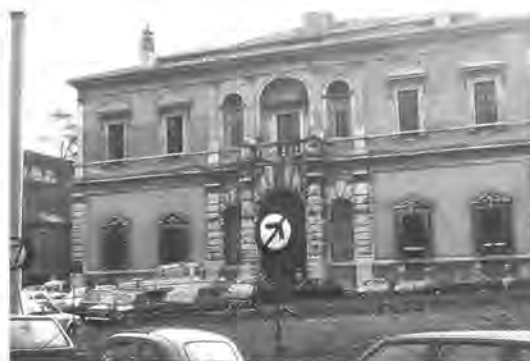
Het Museum van de Villa Giulia in Rome. In de magazijnen bevindt zich het materiaal afkomstig uit de 19de- en begin 20ste-eeuwse Italiaanse opgravingen in Satricum.

Antefixen onderzoeken in de Villa Giulia. Hoe doe je dat? Er was niemand die ik kende die dat ooit had gedaan. Ik had één wetenschappelijk artikel over dat onderwerp gevonden, van een geleerde Amerikaanse mevrouw Nancy Winter, waarvan ik helemaal niets begreep, van het artikel dan. Met de dame in kwestie is later een hartelijke vriendschap gesloten. Maar hoe begin je? Gelukkig had Boersma me verteld dat je gewoon